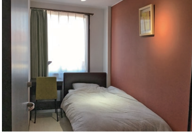
シングルベッドルーム