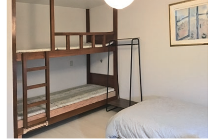
ファミリールーム