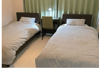
ツインベッドルーム