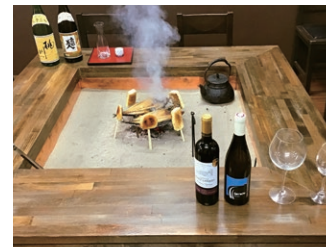
お休み処・観音亭